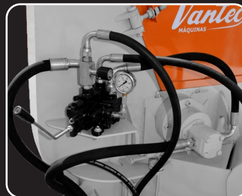
controle manual de velocidade de alimentação control manual de la velocidad de alimentación