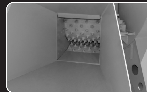
boca de alimentação boca de alimentación